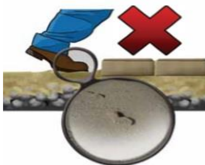
Figura 02 – Não Pisar na Camada de Assentamento

Fonte: Manual de Pavimento Intertravado, Associação Brasileira de Cimento Portland, 2010.