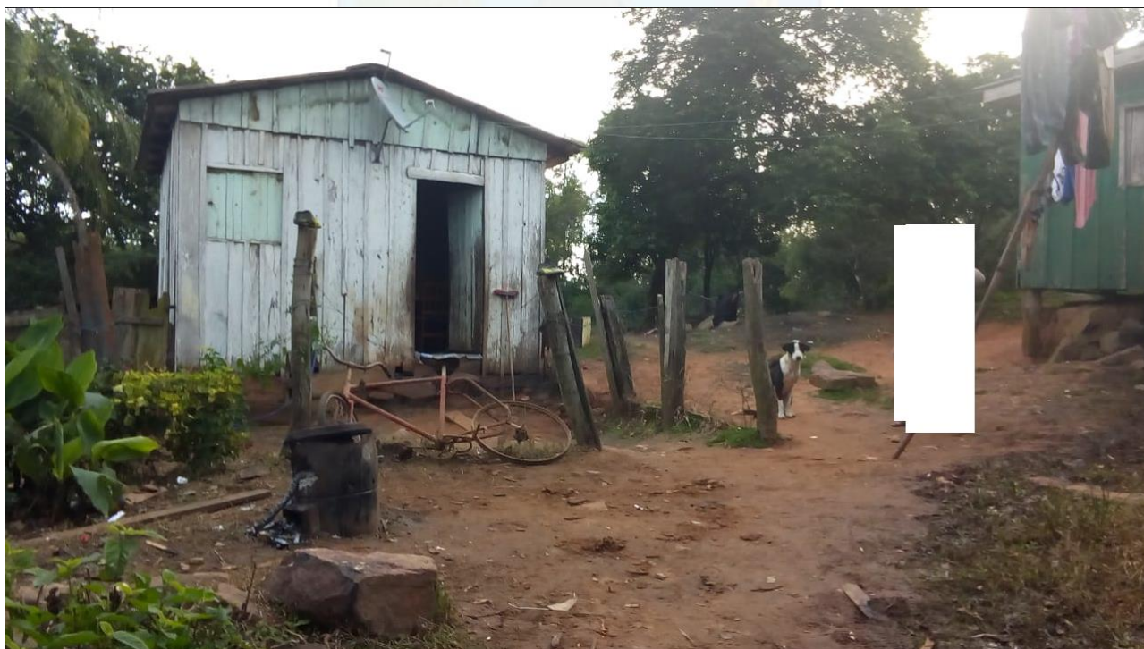
Foto 01/04 - Local onde a Obra será executada

Consiste na execução de obras civis de dois sanitários na Vila do Sabugueiro, Zona Rural de General Câmara.