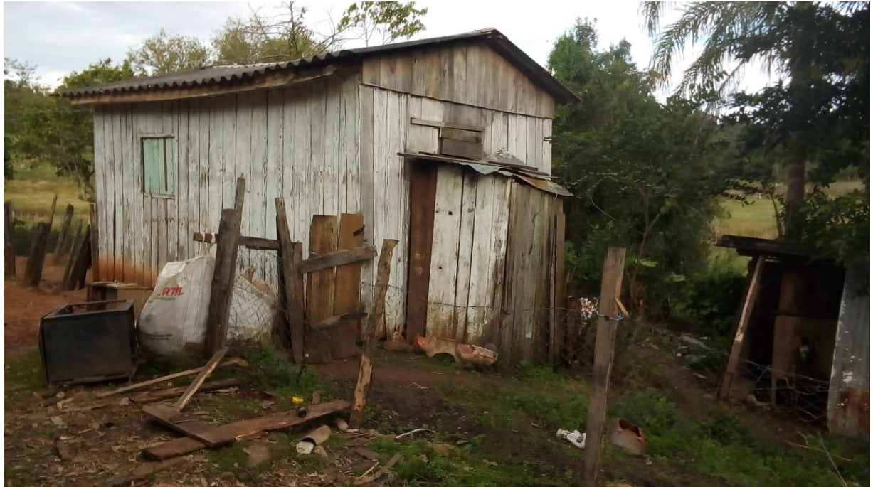
Foto 02/04 - Local onde a Obra será executada