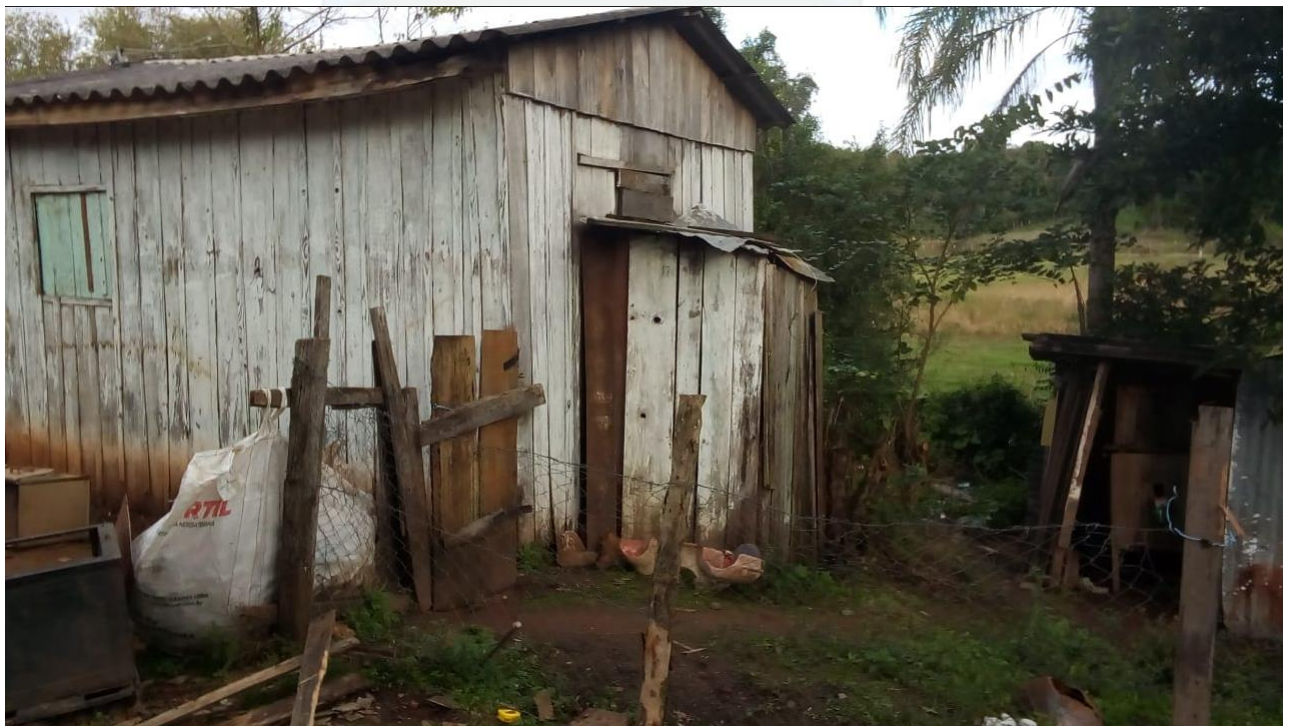
Foto 03/04 - Local onde a Obra será executada